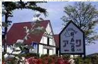
館々森ファームマーケット Ark館々森