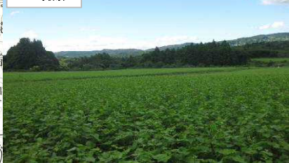
そば二毛作 (有エム・ジー・オー)