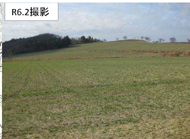
有機小麦団地 (株アーグ)