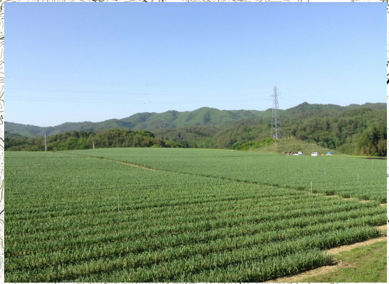
ニンニク団地(丸越農園)