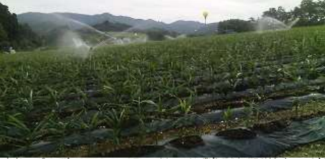
シウガ団地(丸越農園)